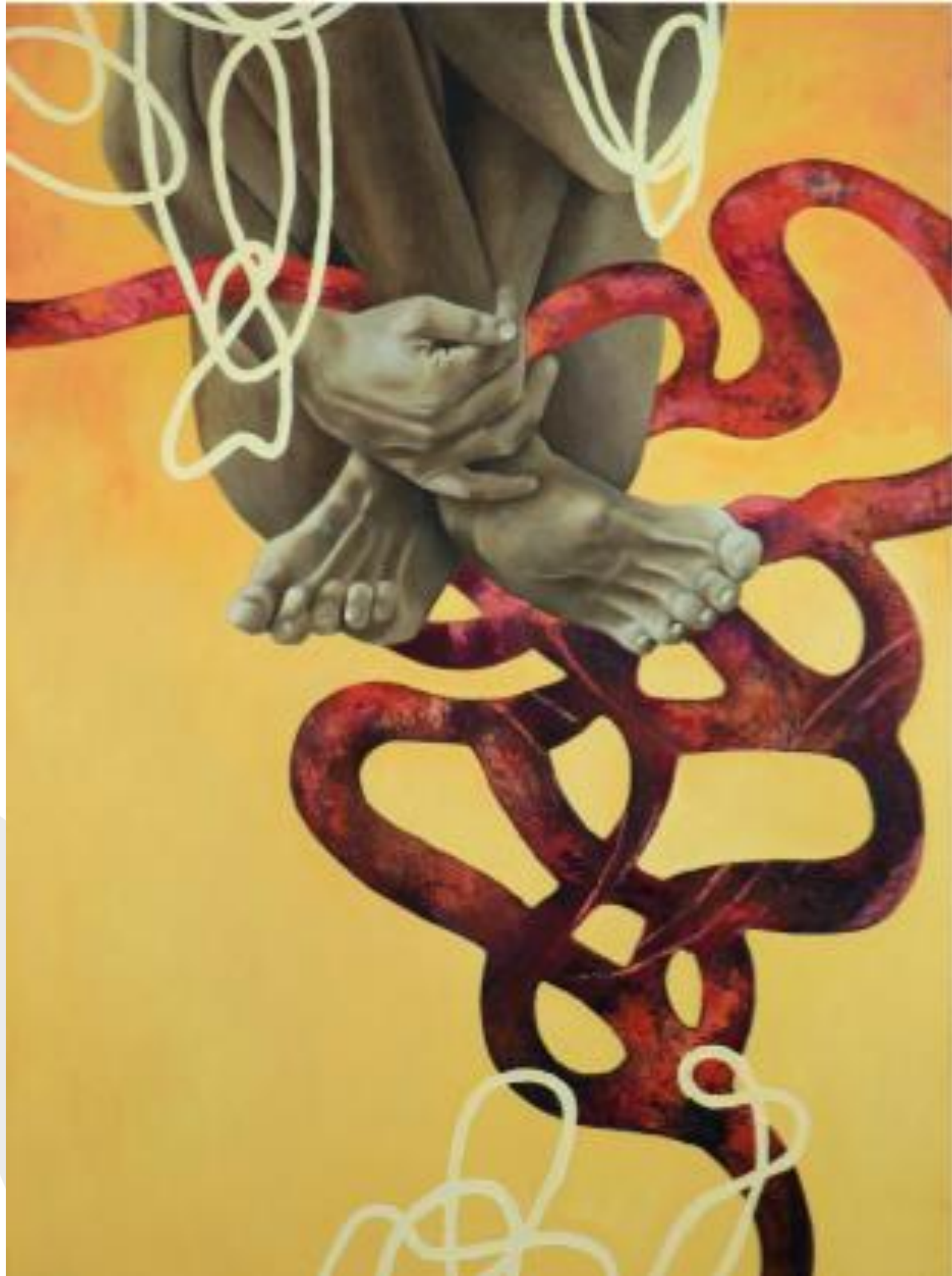
Mi refugio Óleo s/tela 80 x 60 cm $,25,520 mx