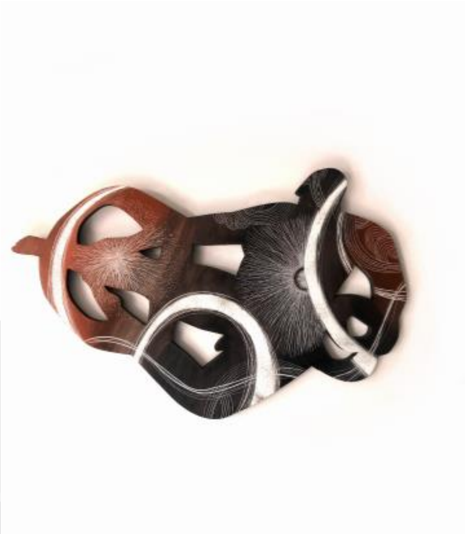
Destellos Óleo s/mdf 40 x 60 cm $,11,600 mx