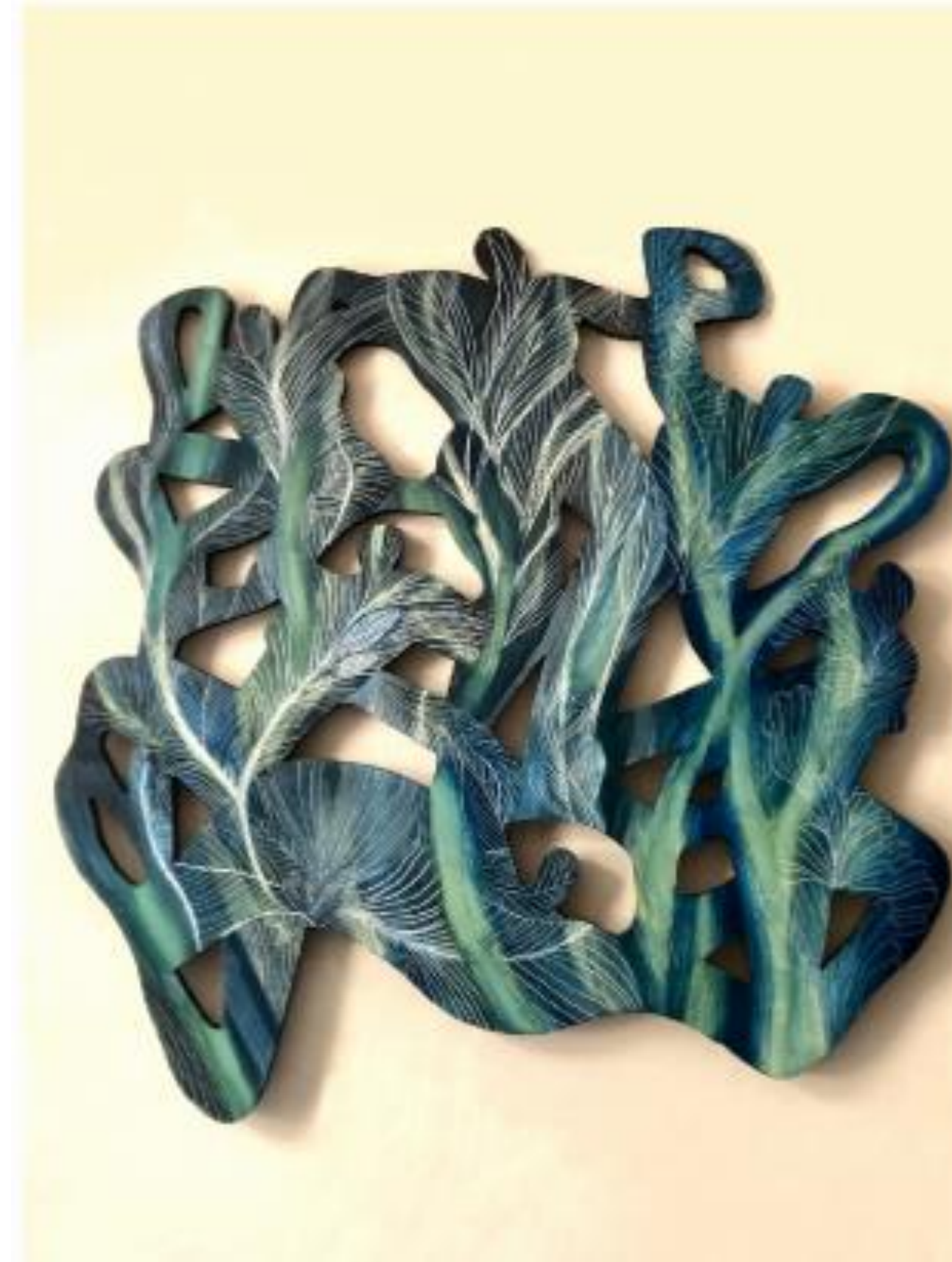
Somos semilla Óleo s/mdf 56 x 60 cm $13,920 mx