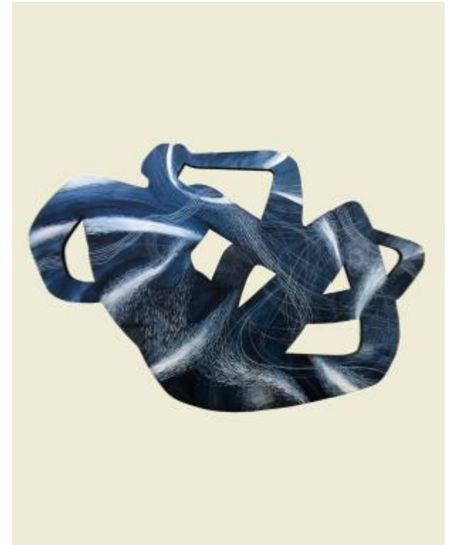
Cometa Óleo s/mdf 40 x 60 cm $11,600 mx