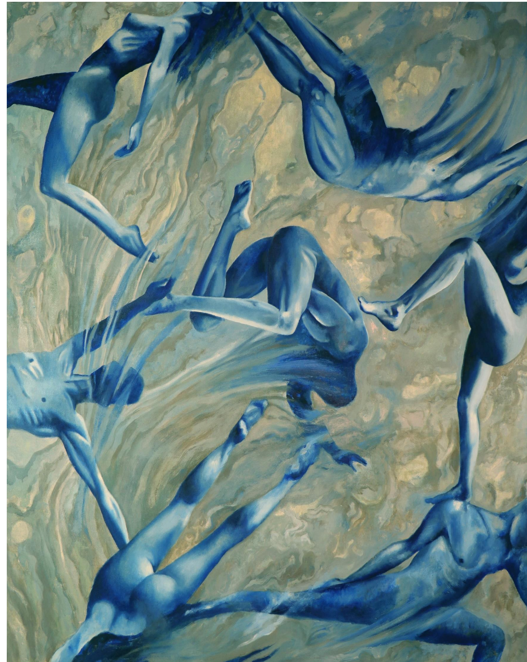
Flotar al viento Óleo s/tela 100 x 80 cm $39,440 mx