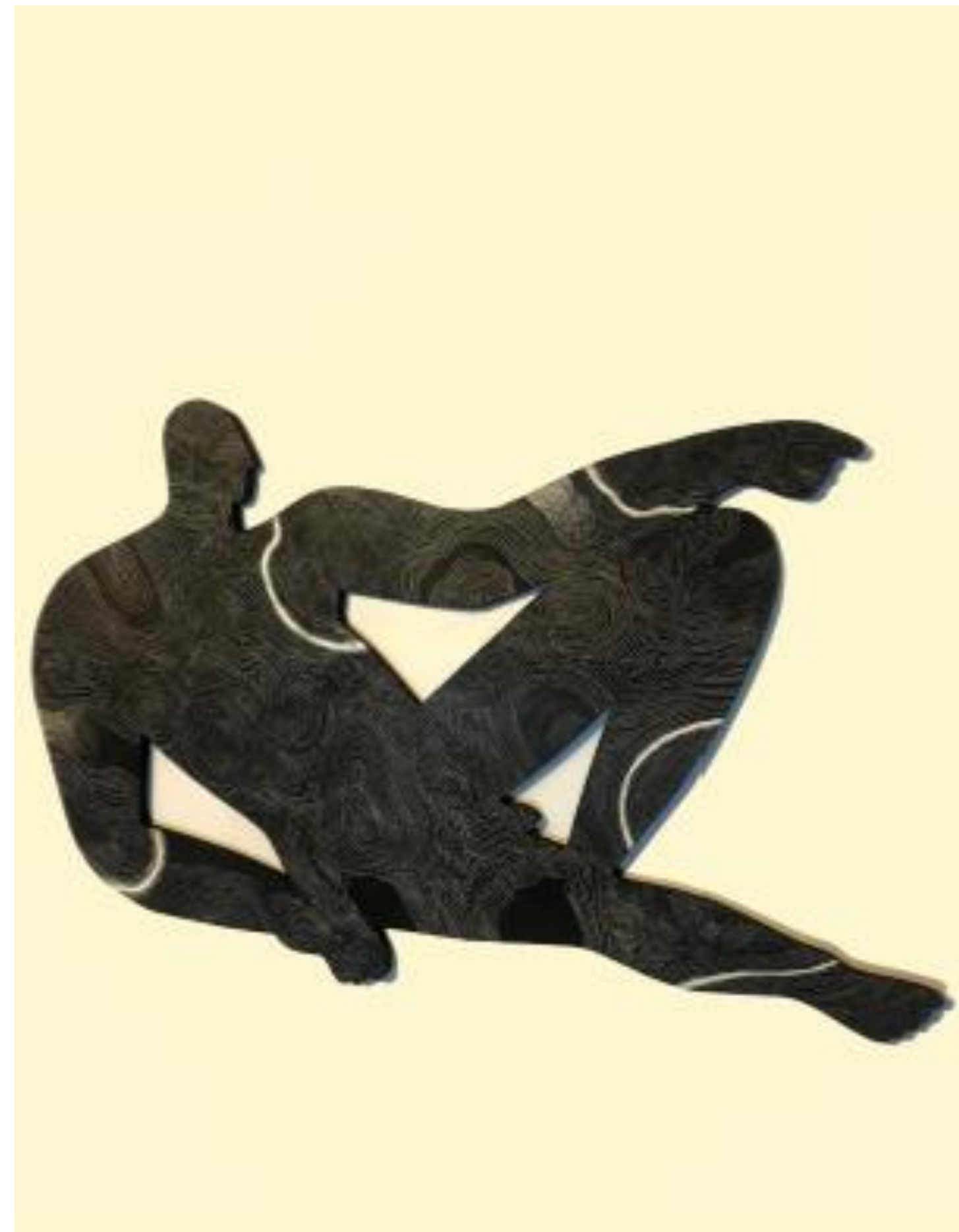
Creación Óleo s/mdf 38 x 60 cm $11,600 mx